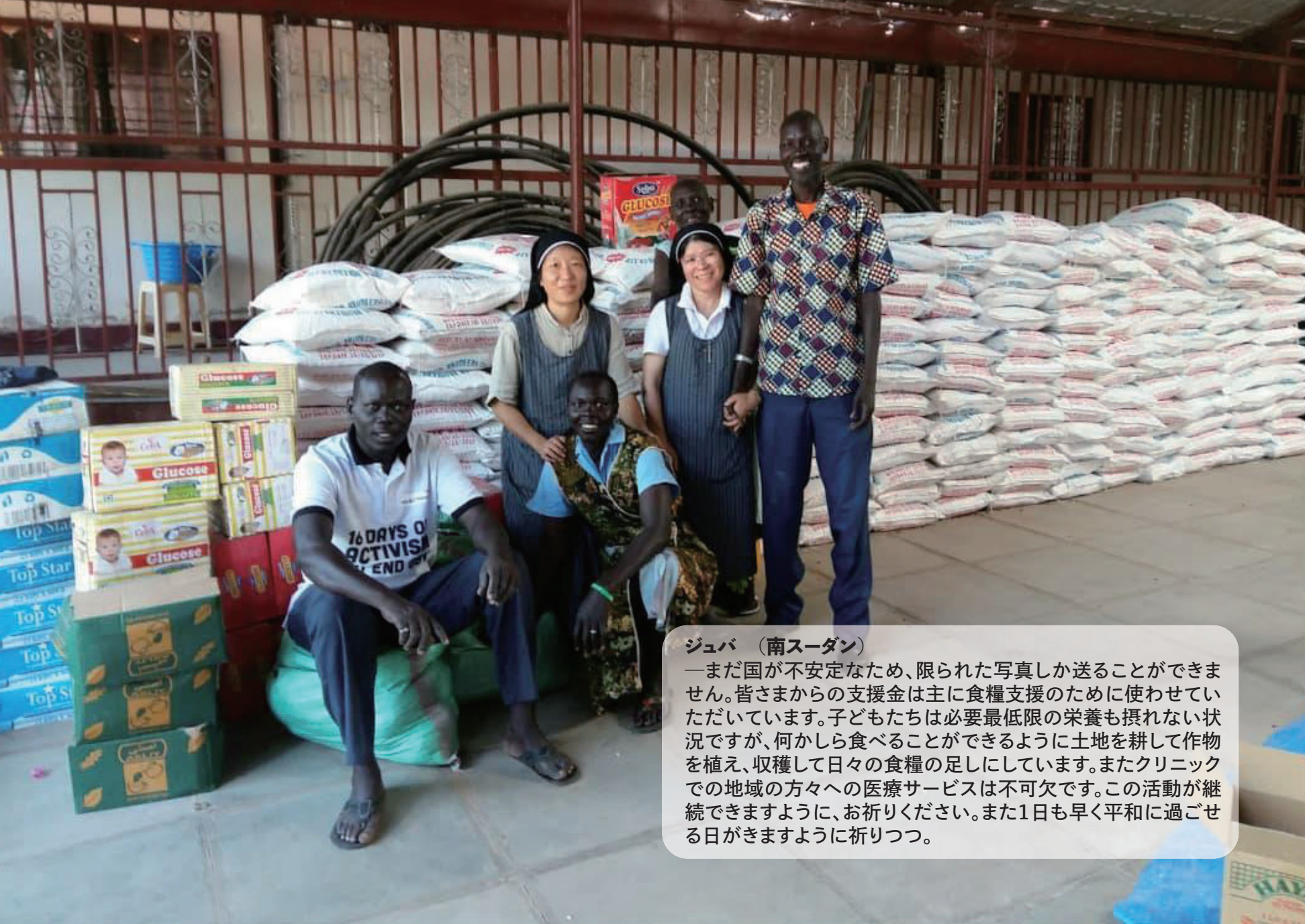
ジュバ (南スーダン) —まだ国が不安定なため、限られた写真しか送ることができません。皆さまからの支援金は主に食糧支援のために使わせていただいています。子どもたちは必要最低限の栄養も摂れない状況ですが、何かしら食べることができるように土地を耕して作物を植え、収穫して日々の食糧の足しにしています。またクリニックでの地域の方々への医療サービスは不可欠です。この活動が継続できますように、お祈りください。また1日も早く平和に過ごせる日がきますように祈りつつ。