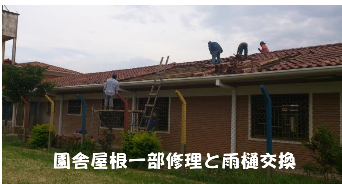
園舎屋根一部修理と雨樋交換