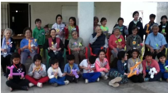
日本人老人ホーム「日亜荘」を訪問 （日本人学校）