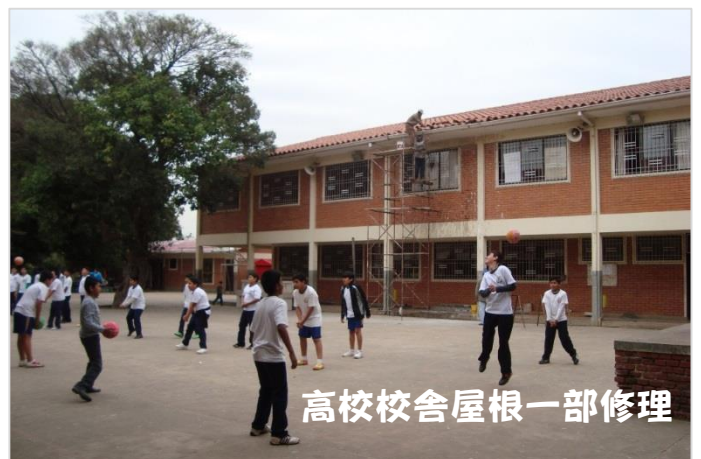
高校校舎屋根一部修理