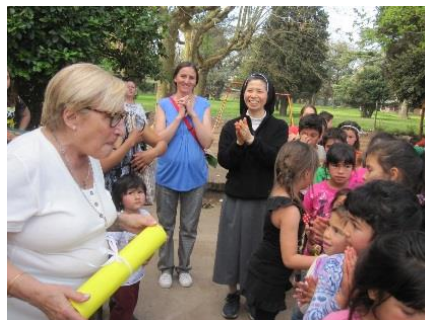
私立学校「YMCA」の招待を受けて （地域の子供たち）