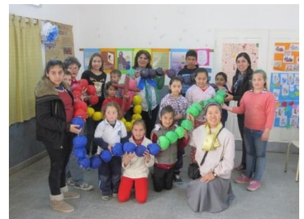
ロザリオの月に （地域の子供たち）