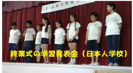
終業式の学習発表会（日本人学校）