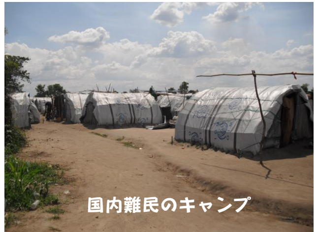
国内難民のキャンプ

こちら南スーダンは、2016年7月、5回目の独立記念日に、前政府の分裂が起こり、今も不安定な情勢が続いています。私達も7月末から8月末まで、ウガンダに一時避難していました。2013年のクーデターの時は避難しませんでした。今回は私達の教会がある村で、レイプ事件が発生しはじめましたので、主任神父の強い勧めで国外退避しました。ウガンダ国境の最大避難キャンプ近くの地元の修道会のシスターの所でお世話になりました。この場所に辿り着くために、数ヶ所、全く未知のウガンダの国を転々としたので、国外避難する大変さを、体験しました。それでも私達は修道会を探せば、何とかあったのですが、南スーダンの避難民は、行くあてもなく、さ迷い、やっと難民キャンプにたどり着き、力尽きて亡くなる人も多いと聞きます。実際、難民キャンプを何度か訪問しその現状を目の当たりにしました。