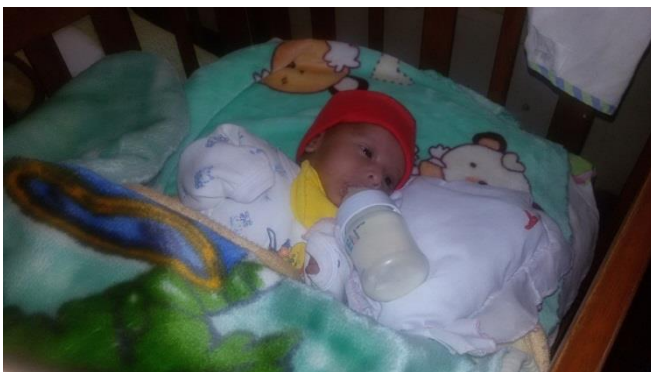
生後3週間の赤ちゃん