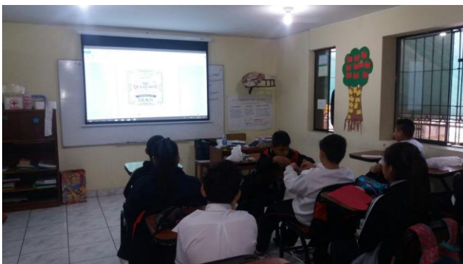
マルチメディアを活用して勉強する生徒たち