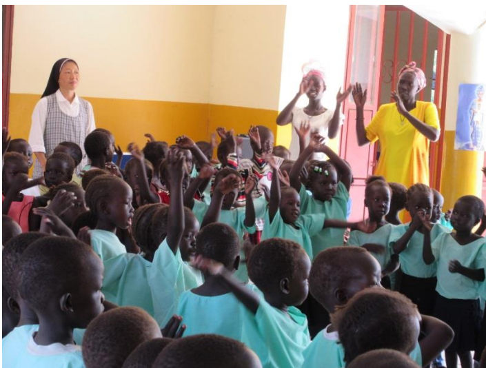
子どもセンターでの活動