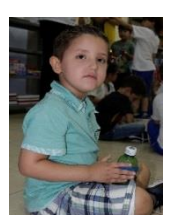
サン・マテウス カリタス学園の生徒たち