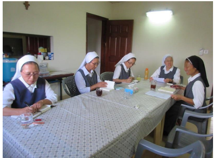
南スーダン共同体