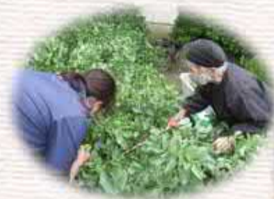
( そら豆の収穫 )