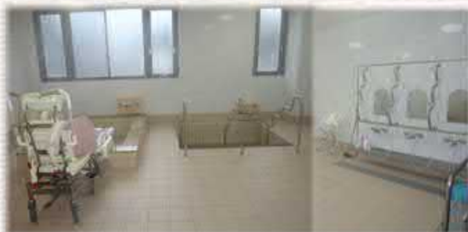
( 浴室 )