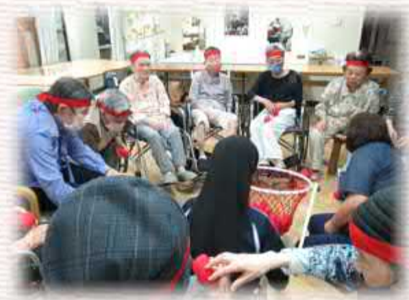
( 運動会 )