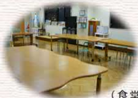
( 食堂・多目的室 )