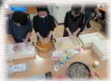
( コロッケ作り )