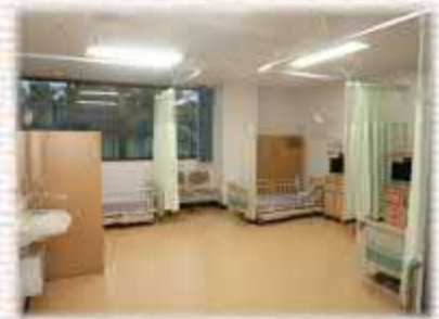
( 居室3人部屋 )