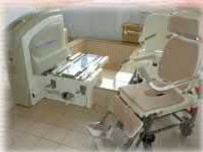
( 器械浴 )