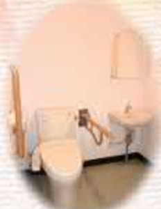
( トイレ )