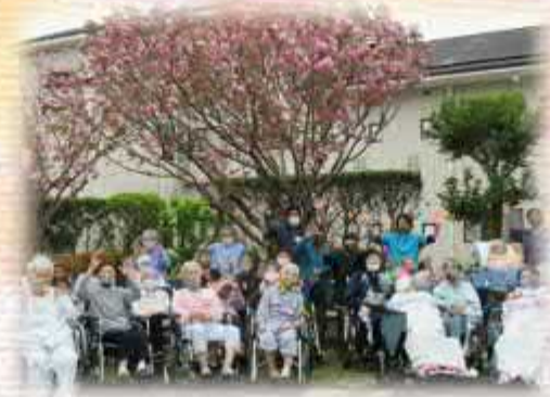
( お花見 )

中庭やベランダのプランター栽培で は、トウモロコシ、お芋、そら豆等 を育て、収穫の喜びを皆で味わっ ています。