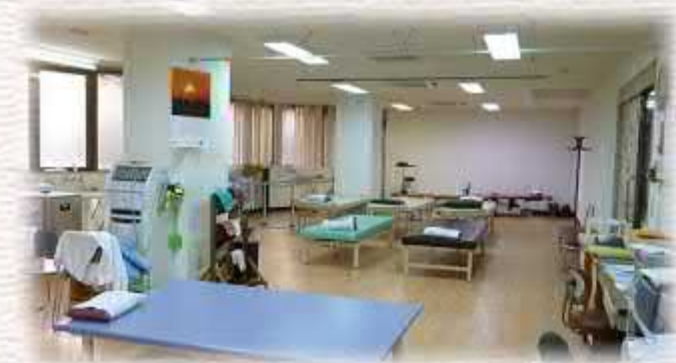
( リハビリ室 )